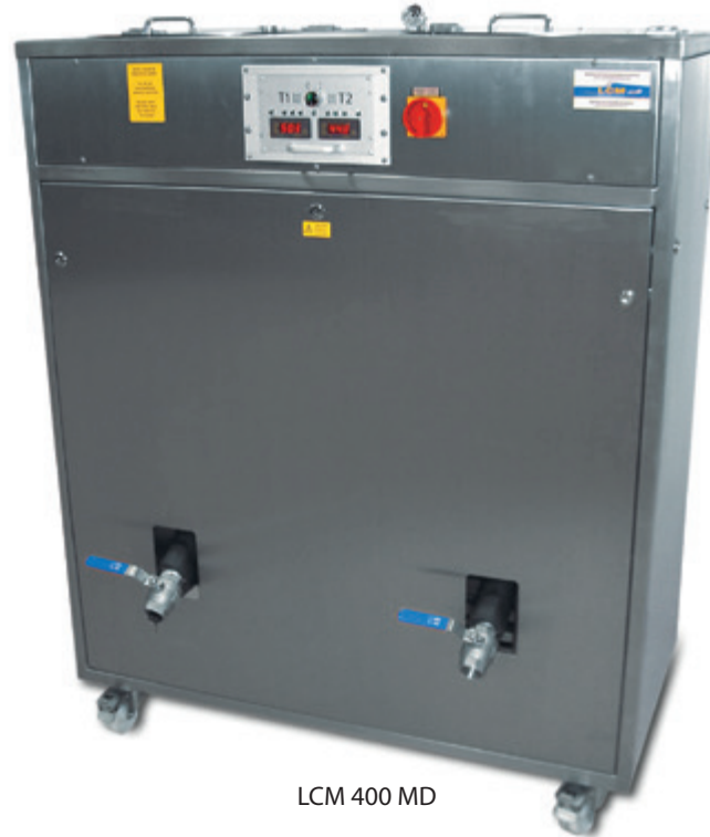
LCM 400 MD

Die Schokoladenauflöser können einfach gereinigt werden. Die hochwertige Isolierung der Tanks hält den Stromverbrauch sehr gering.