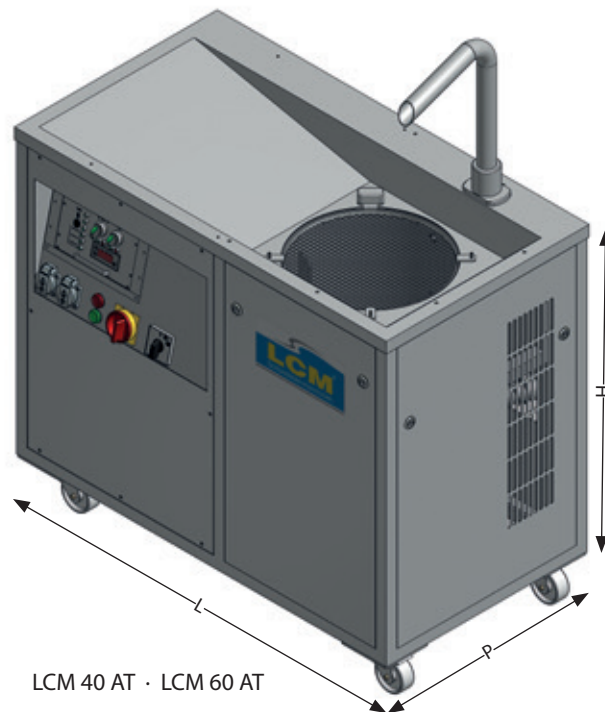
LCM 40 AT · LCM 60 AT