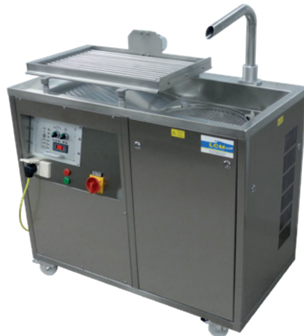
LCM 40 AT · LCM 60 AT