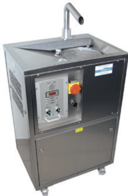
LCM 25 AT

L'utilisation, le changement de chocolat et le nettoyage sont très simples sur ces modèles.